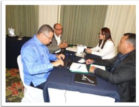
Grupo de Trabajo República Dominicana

TRAFFIC the wildlife trade monitoring network