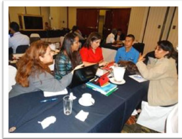
Grupo de Trabajo Panamá