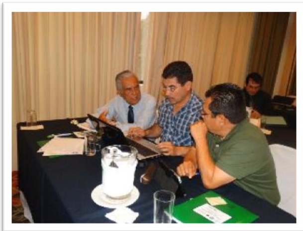
Grupo de Trabajo Honduras