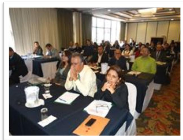
Participantes Tercera Reunión ROAVIS