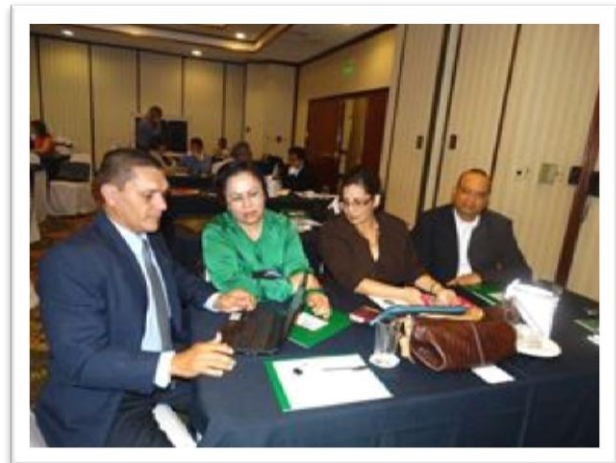
Grupo de Trabajo El Salvador